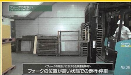
⑧ フォークの取扱い（5事例）