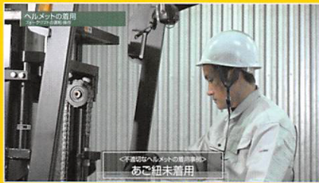
① ヘルメットの着用（3事例）

フォークリフトによる労働災害や貨物事故の原因となった危険運転・操作を解説しています。