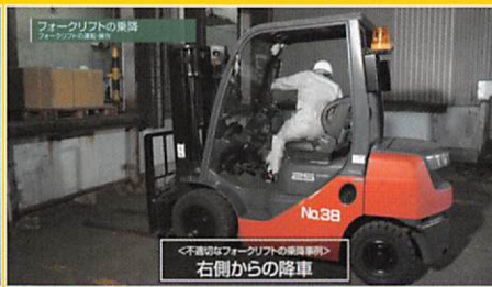
② フォークリフトの乗降（3事例）