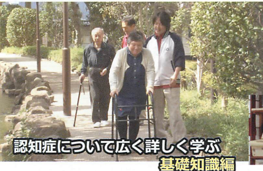
認知症について広く詳しく学ぶ 基礎知識編