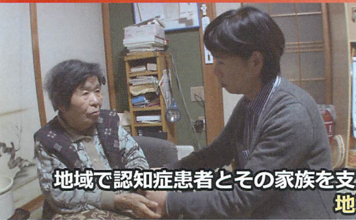
地域で認知症患者とその家族を支える 地域活動編