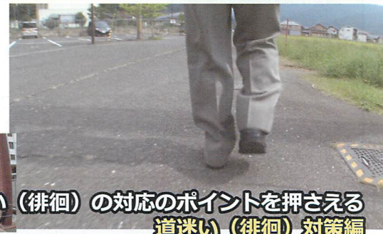
道迷い（徘徊）の対応のポイントを押さえる 道迷い（徘徊）対策編