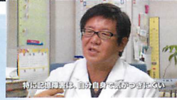
特に記憶力は、自分自身で気づくまでに 遅い