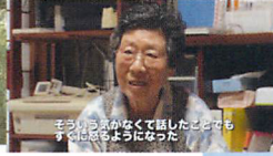
そういえばかなくて悩んだことも 今は忘るようになった