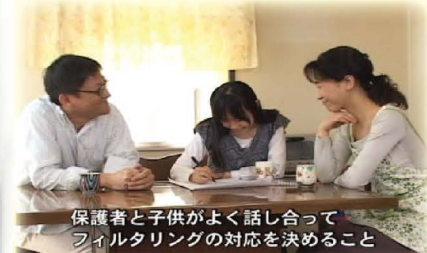
保護者と子供がよく話し合って フィルタリングの対応を決めること