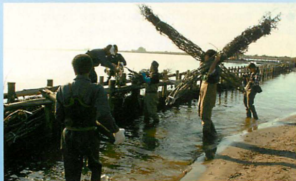
灌木材を使った消波堤