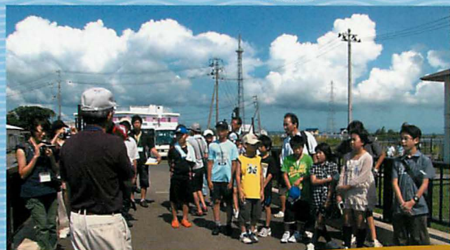
▲2010子どもフォーラム