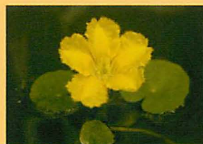
アサザの植え付け