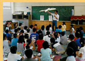
小学校での出前授業